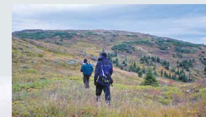
Eastern Alpine Guide, easternalpine.org