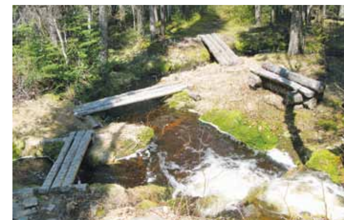
Eastern Alpine Guide, easternalpine.org

Compte tenu de la sensibilité de la lande arctico-alpine, la pratique de la motoneige est interdite là où la signalisation le proscrit (sommets). Toutefois, des dispositions particulières permettent un accès limité à la zone. Veuillez vous informer auprès de Tourisme Côte-Nord : 1 888 463-5319