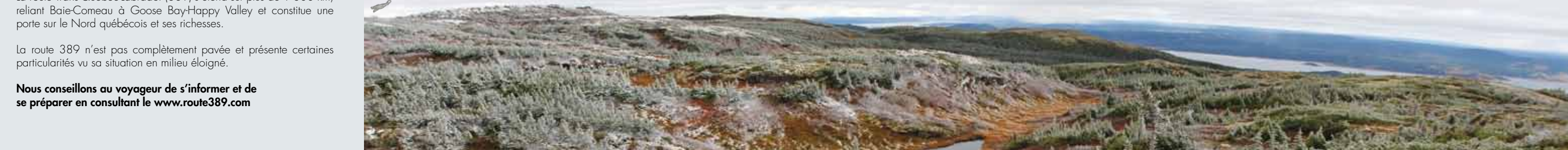
Eastern Alpine Guide, easternalpine.org