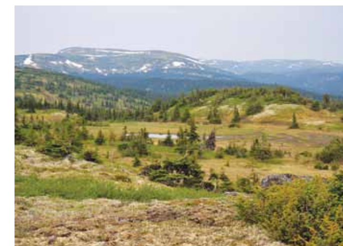
Eastern Alpine Guide, easternalpine.org

Les déplacements à l'intérieur de ce massif éloigné et isolé se font en orientation autonome (sauf sans les sentiers d'accès présentés dans cette section). Aucun service de secours en montagne n'est offert et il n'y a aucune réception cellulaire dans le secteur. Vous devez donc être en situation d'autonomie complète pour votre orientation et votre sécurité. Veuillez prendre connaissance des informations présentées dans cette section.