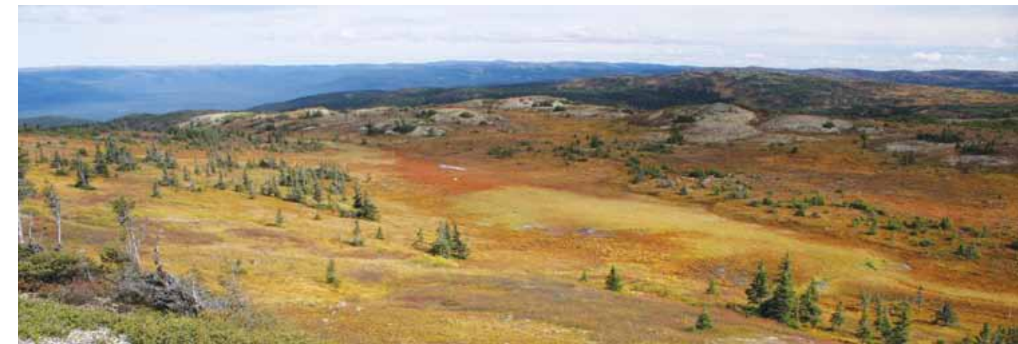
Eastern Alpine Guide, easternalpine.org

Visitez le site des amis des monts Groulx pour plus d'information.